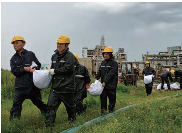
为提高应对汛情的救援能力和反应能力,7月11日,利海化工公司开展了防汛专项应急预案演练,进一步增强了防汛抢险队伍的责任意识和紧迫感,为有效应对汛情积累了宝贵经验。(余迪克 刘欣)

创新抓科研,培育发展新引擎。集聚和利用高端创新资源,积极开展盐业生产、农养种植等方面的科技项目攻关,充分发挥自主创新团队效能,构建协同创新发展体系,深化与江苏海洋大学、七一六研究所对接合作,运用更多市场化方式,围绕主导产业发展需求,培育各类高素质人才和高水平创新团队,为班组改革、工艺革新、技术提升等工作闯出新路线,夯实高质量发展硬支撑。(许彦彦)