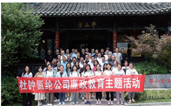
为深入学习贯彻党的二十大精神,加强党风廉政建设,筑牢党员干部拒腐防变的思想防线。近日,氨纶公司纪委组织党员干部前往扬州平山堂廉政教育基地参观学习,接受廉政清风的洗礼。(王瑞清)

搞好警示教育,居安思危,警钟长鸣。组织“90后”年轻管理人员开展廉政宣誓、廉洁知识测试、实境教育等活动;把握重要时间节点,通过发放廉洁短信、提示函等形式,拧紧纪律之弦;“一把手”为党员授廉政党课,不断增强广大党员防腐拒变“免疫力”。(陈炳辰)