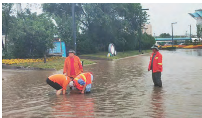
7月11日,一场强降雨,使花果山大道、新光路、玉竹路等路段成“看海”模式,为保证市民的安全通行,华茂盛达市政公司第一时间启动防汛应急预案,开展防汛抢险工作,为人民群众通行及时提供安全保障。(李方艳)

▲近日,格斯塔融资担保公司与交通银行连云港分行开展业务交流,就新形势下加强银担合作等相关事宜进行了专题座谈。(陈侠素)