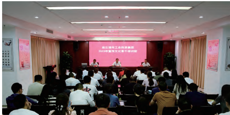
为了深入学习贯彻党的二十大精神，做好新时代企业宣传文化工作，7 月 20 日至 21 日，集团公司党委举办 2023 年度宣传文化骨干培训班。来自各单位的 56 名宣传文化骨干参加培训。（工宣）