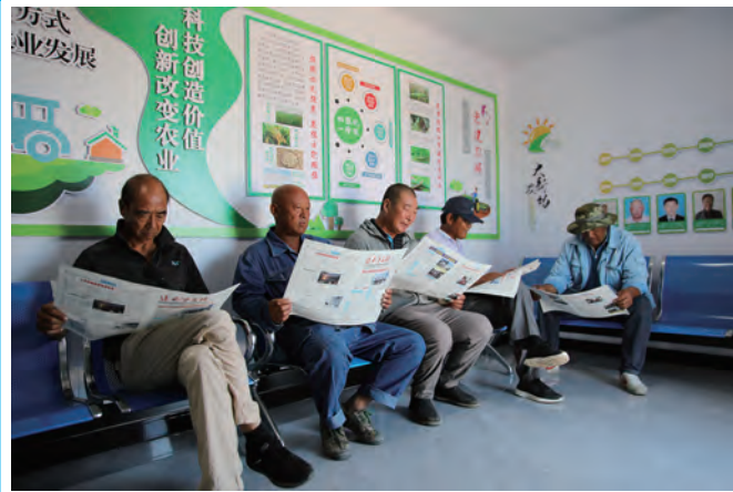
近日，青口投资公司大新农场党支部积极搭建“党建+技术+服务”平台，精心打造田状元驿站，将田状元在农业生产中好的做法经验分享给其他种植户，真正把各项技术切实传授到点、落实到田，稳步提升种植水平。（王璐）

挺膺担当向前行。当以赤诚之心筑牢干事创业基石，秉持马上就办、办就办好的干事态度，锻造想干事、能干事、干成事的干事作风，践行立说立行、事不过夜的工作作风，做到关键时刻冲得上、危难关头豁得出来，以“满分状态”提振干事创业的精气神。当以“则负无穷之责任”的勇毅担当，主动到一线了解民情、收集民意，帮助职工解决“生命安全”的大事、“鸡毛蒜皮”的小事、“愁眉苦脸”的难事。当鼓足“明知山有虎，偏向虎山行”的无畏勇气，以时不我待、只争朝夕的紧迫感，投身经济发展主战场、为民服务第一线、攻坚克难最前沿，挑最重的担子，啃最硬的骨头，接最烫手的山芋，务实功、出实招、求实效，稳扎稳打走好新时代赶考路。